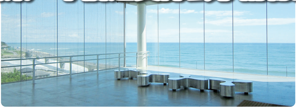
日立駅から太平洋を望む